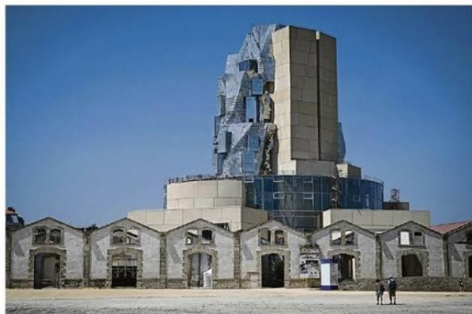
Reputée pour son école de photographie et son festival, Arles accueille en 2013 la fondation suisse Luma, qui y a fait édifier une tour, conçue par l'architecte américain Frank Gehry, afin d'accueillir des installations d'art moderne.

La visite est gratuite, mais elle a un prix : 1 million d'euros pour payer la logistique, les trages, la communication et les photographes, une spécificité unique en France. La famille Rocher met 40 % de sa poche. Le président des collectivités, du mécénat local, des ventes de catalogues et, depuis peu, de la cession de la commune à Baden, en Autriche, qui expose les œuvres présentées à La Gacilly avec un an de décalage. « Ça va le coup », estime le maire, sur la foi d'une étude de Probationis. De juin à octobre, 300.000 personnes font le déplacement vers cette commune de 2.200 habitants qui compte 1.250 places de restaurant et une centaine de commerces et d'artisans